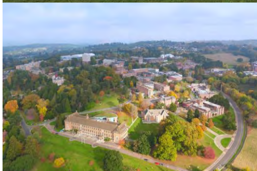
UNIVERSITY OF EXETER