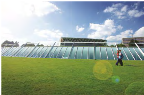
UNIVERSITY OF EAST ANGLIA